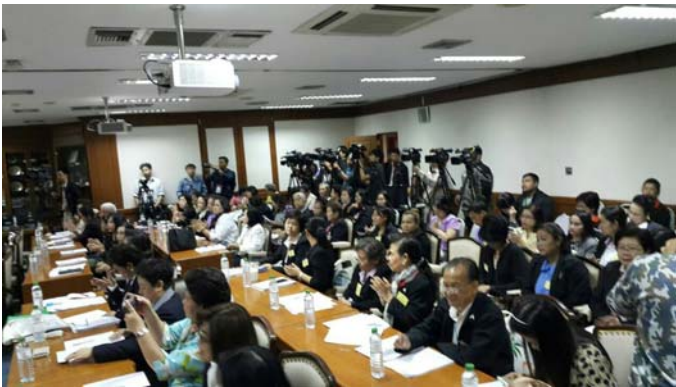
ผู้เข้าร่วมเวทีรับฟัง