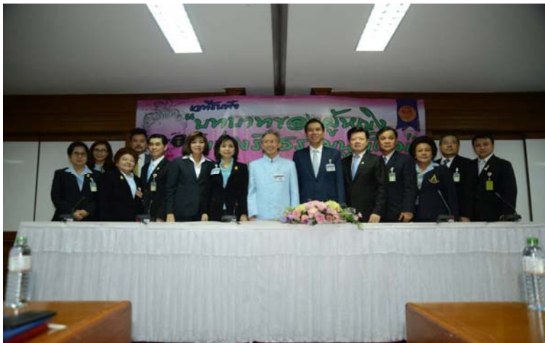
ภาพหมู่คณะกรรมการกิจการสตรี

ร่างรัฐธรรมนูญใหม่ที่ได้รับจากเวทีเสนอต่อคณะกรรมการยกร่างรัฐธรรมนูญเพื่อนำไปพิจารณาต่อไป โดยสาระสำคัญจากเวทีรับฟังความคิดเห็น สรุปได้ดังนี้