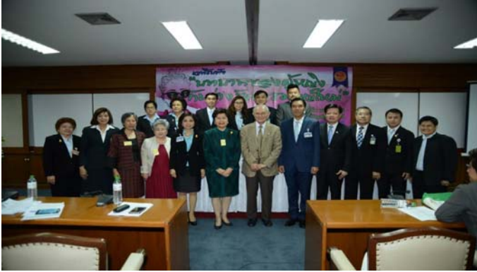
ถ่ายภาพหมู่ร่วมกัน