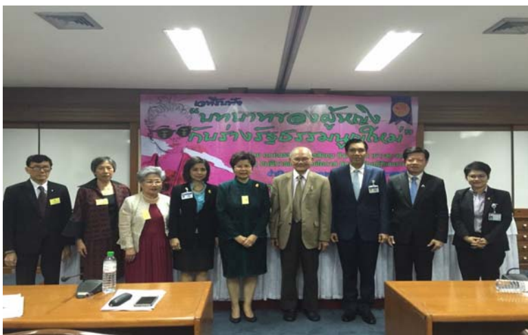
ภาพหมู่องค์กรปาฐกถาและวิทยากร